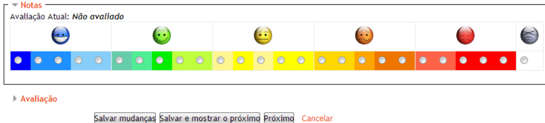
Figura 2. A Escala de Ícones do Modelo LV aplicada ao Moodle

sua vez associam-se a critérios subjacentes de menor escala, representados por tonalidades de cor da categoria macro. Desta forma, ficam estabelecidos dois critérios para a avaliação, sejam nas mensagens nos fóruns ou arquivos de portfólio.