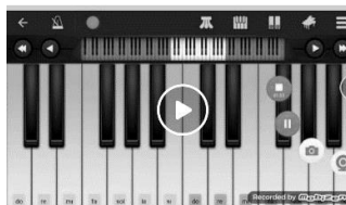
Figura 1: Performance do aluno no aplicativo Perfect Piano utilizando o gravador de tela

notas musicais de uma canção, e cada um deles, respeitando seu tempo e ritmo, treinava em suas residências para a apresentação na aula seguinte, via Google Meet . Ademais, alguns alunos gravavam suas performances utilizando um aplicativo de gravação de tela de smartphones (ver Figura 1) ou compartilhavam o áudio disposto no app pelo grupo de WhatsApp . De acordo com Miyamoto e Montanha (2016), um dos grandes benefícios dos recursos digitais móveis na Educação é a possibilidade de aprender momentaneamente, sem barreiras de tempo e de espaço físico.