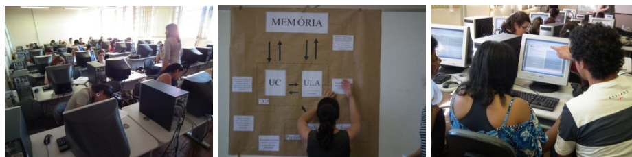
Figura 2. Momentos do Laboratório de Introdução à Informática.

O Laboratório de Introdução à Informática aconteceu no dia 20 de novembro de 2010, com duração de 4 horas e público de 21 professores. Em um primeiro momento os participantes conheceram conceitos básicos de organização de computadores, periféricos e plataformas, software (sistema operacional e aplicativos) e redes de computadores – enfatizando a Internet, mecanismos de busca, web 2.0 e segurança: SPAM, anti-vírus e arquivos executáveis. Como atividade prática, exploraram o ambiente Desktop e algumas tarefas básicas, como a organização em pastas e arquivos, formas alternativas de realizar a mesma tarefa e recursos de tecnologia assistiva, além do editor de textos. A Figura 2 apresenta alguns momentos deste encontro.