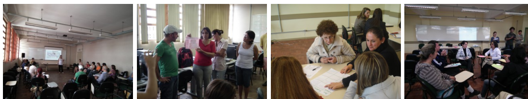
Figura 4. Momentos dos workshops.

Realizados no período de recesso escolar, a adesão dos professores ao II e ao III workshop foi bem reduzida, com participação em torno de 11 e 17 pessoas. A qualidade das discussões, entretanto, não ficou comprometida e os professores presentes aproveitaram bem as situações propostas, avaliando positivamente a dinâmica de trabalho desenvolvida e propondo novas ações – a organização das oficinas de trabalho, em particular, teve como referência a prática Future Workshop . Estes dois workshops , que valorizaram a participação de professores da comunidade escolar – inclusive como palestrantes, junto a servidores e discentes da Universidade – e promoveram a reflexão sobre a ação, influenciaram a programação do IV workshop , provocando a organização da mesa redonda com a participação de representantes da gestão local da educação e da Universidade, além de dar continuidade à valorização das experiências locais. A Figura 4 ilustra a dinâmica dos workshops .