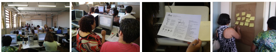
Figura 3. Momentos do Laboratório de Introdução à Web.

O Laboratório de Introdução à Web foi realizado no dia 27 de novembro de 2010 e atendeu a um grupo de 23 educadores, envolvidos durante 4 horas. Além de terem acesso a conceitos básicos da Internet, realizaram atividades teórico-práticas que apresentaram e discutiram o uso de navegadores, mecanismos de busca e a pesquisa em repositórios digitais. Ainda, os participantes que não tinham endereço de correspondência eletrônica puderam criar seu próprio e-mail . Momentos deste laboratório são apresentados na Figura 3.