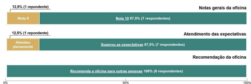
Figura 3. Avaliação da oficina (nota, atendimento de expectativas e recomendação).

Como ilustrado na Figura 3, na avaliação geral da oficina, sete participantes (87,5%) atribuíram nota 10 e uma (12,5%) atribuiu nota 8. Sete participantes (87,5%) também afirmaram que a oficina superou suas expectativas e uma (12,5%) indicou que atendeu plenamente às expectativas. Além disso, ao serem perguntadas se recomendaria a oficina a outras pessoas, 100% das respondentes sinalizaram que sim. Esses resultados sinalizam a aceitação da proposta. A boa aceitação das oficinas neste estudo segue a mesma linha dos trabalhos de Laranjeira e Bezerra (2023) e Nunes et al. (2024), que também adotaram oficinas como estratégia para estimular o interesse de meninas e mulheres pela área de TI.