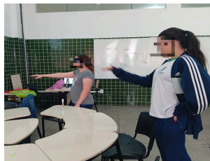
(a) Atividade orientando o robô – pegar a jaqueta na cadeira.

A primeira atividade desplugada envolveu o reconhecimento de padrões e a abstração por meio de um “bilhete misterioso”, apresentado no formato de uma charada que deveria ser decifrada pelas participantes a partir da análise de pistas. Em seguida, foi realizada a dinâmica “Orientando o Robô” (Figura 1), na qual três voluntárias representaram os papéis de robô (com os olhos vendados), programadora e inteligência artificial. O desafio consistia em transmitir comandos claros e sequenciais para que o robô realizasse a tarefa de vestir uma jaqueta, explorando de forma prática os pilares do PC e estimulando a colaboração e a construção de algoritmos.