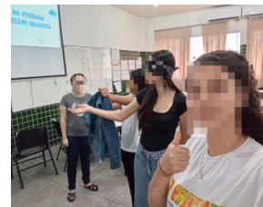
(b) Atividade orientando o robô – vestir a jaqueta.