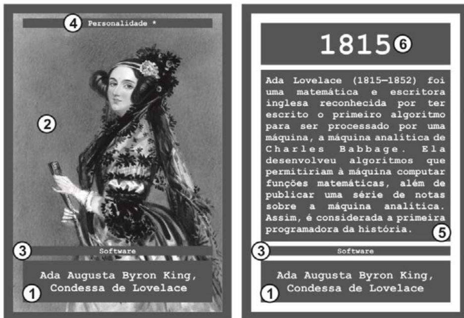
Figura 1. Exemplo de carta de Personalidade feminina do jogo Computasseia e seus elementos indicados

disposição sequencial em ordem crescente da Data das cartas, constituindo uma cronologia. Cada jogador recebe no início do jogo um conjunto de seis cartas atribuídas de forma aleatória. As demais cartas restantes do jogo são empilhadas em um montante denominado Montante de Compra com a visão da frente voltada para cima. O Computasseia comporta de dois a seis jogadores devido à sua quantidade de cartas atual.