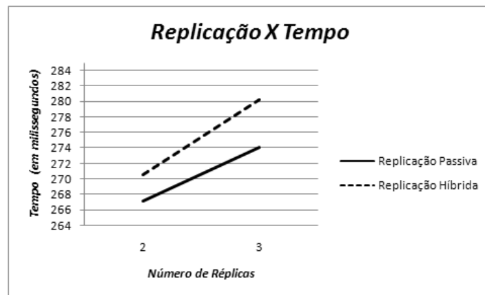
Figura 4. Resultado dos testes em rede.