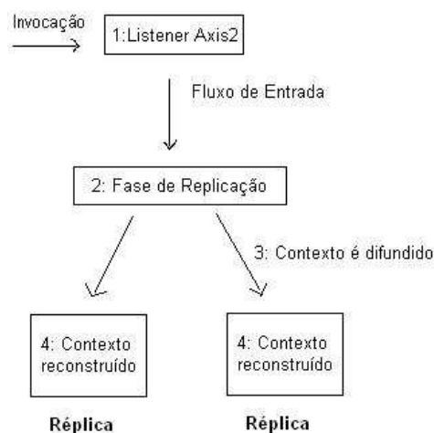
Figura 2. Funcionamento da Replicação Híbrida.

Uma nova fase foi adicionada aos fluxos de entrada e saída intitulada FaseReplicacaoHibrida . O funcionamento do protótipo, no fluxo de entrada, pode ser observado na figura 2.